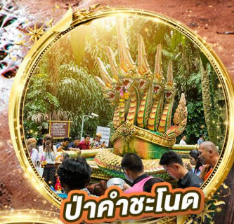
ปากำชะโนด