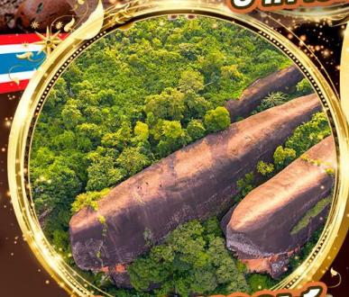
หินสามวาฬ